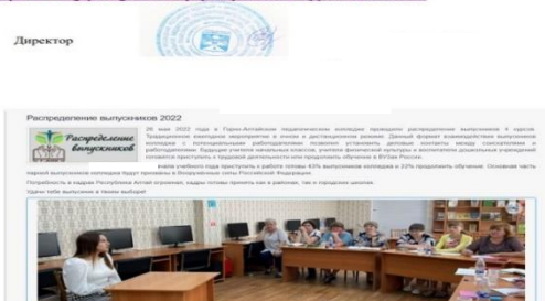
Рисунок 10. Неконкретные показатели исполнения мероприятий

участие в ярмарке вакансий педагогических кадров в образовательной организации Участие в ярмарке вакансий. 22 апреля 2022 года в 10 часов по адресу: корпус А1 посетили «Ярмарку вакансий» колледже посетили распределение выпускников 4 курсов. Традиционное ежегодное мероприятие в очном режиме. 26 мая 2022 года колледже посетили распределение выпускников 4 курсов. Традиционное ежегодное мероприятие в очном режиме. https://www.gapc.org.ru/index.php/raspredelenie-vypusknikov-2022#