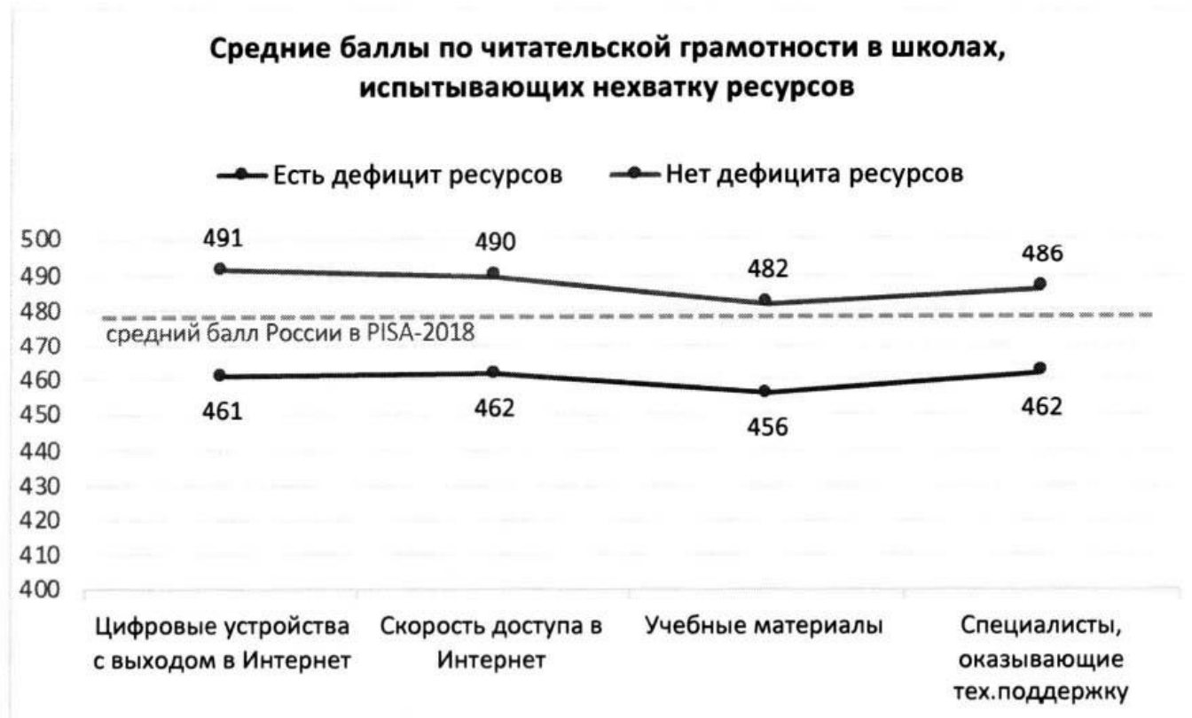
Рисунок 2. Дефициты ресурсов образовательной организации и результаты обучающихся по шкале читательской грамотности PISA относительно среднего результата РФ в PISA-2018

Дефициты ресурсов определялись на основании ответов администрации школ на вопросы анкеты и могут отражать субъективную точку зрения директора.